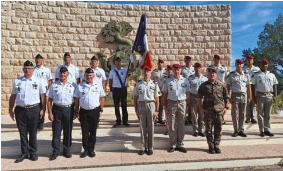
Amicale et CFIM-6 e RPIMa unis dans le souvenir de Bazeilles

Les 31 août et 1 er septembre, les Troupes de marine des quatre coins du monde commémorent les combats de Bazeilles, marquant ainsi l'héroïsme et l'abnégation des marsouins et bigors de la Division bleue face aux Bavarois pendant la bataille de Sedan en 1870.