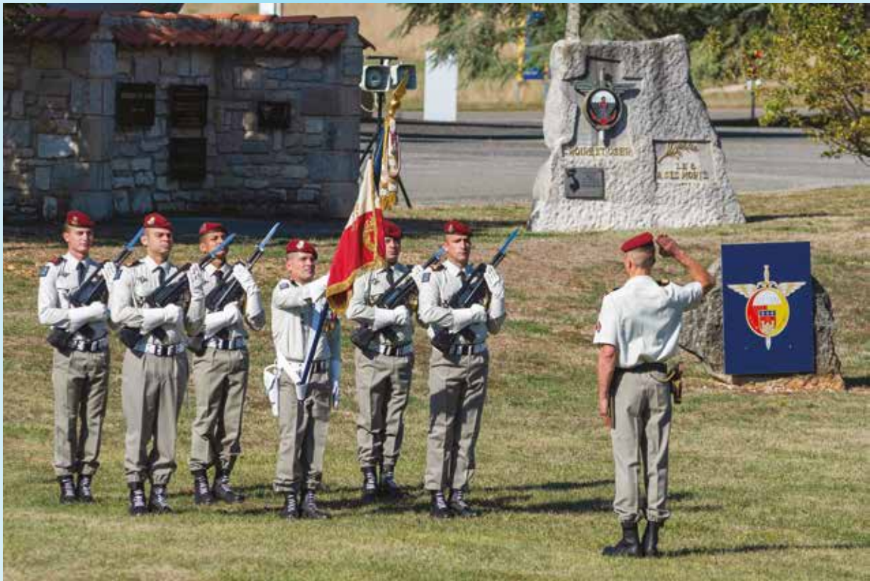
Les honneurs au drapeau du 6

Ces deux journées ont été l'occasion pour tous, amicalistes et paras du CFIM, anciens et jeunes, de partager ses souvenirs, ses expériences, ses projets, à la fois dans les moments officiels comme dans ceux plus conviviaux à leurs popotes. De très bons moments donc.