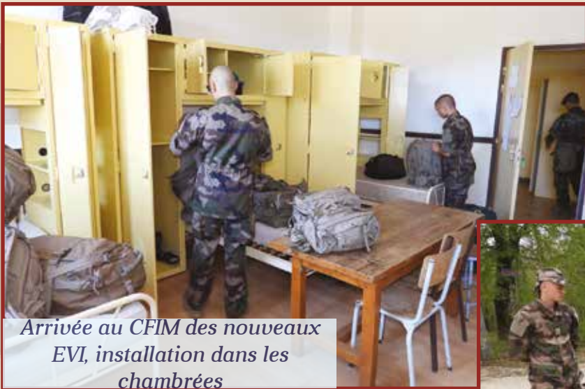
Arrivée au CFIM des nouveaux EVI, installation dans les chambrées