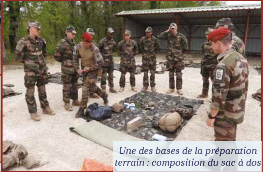
Une des bases de la préparation terrain : composition du sac à dos