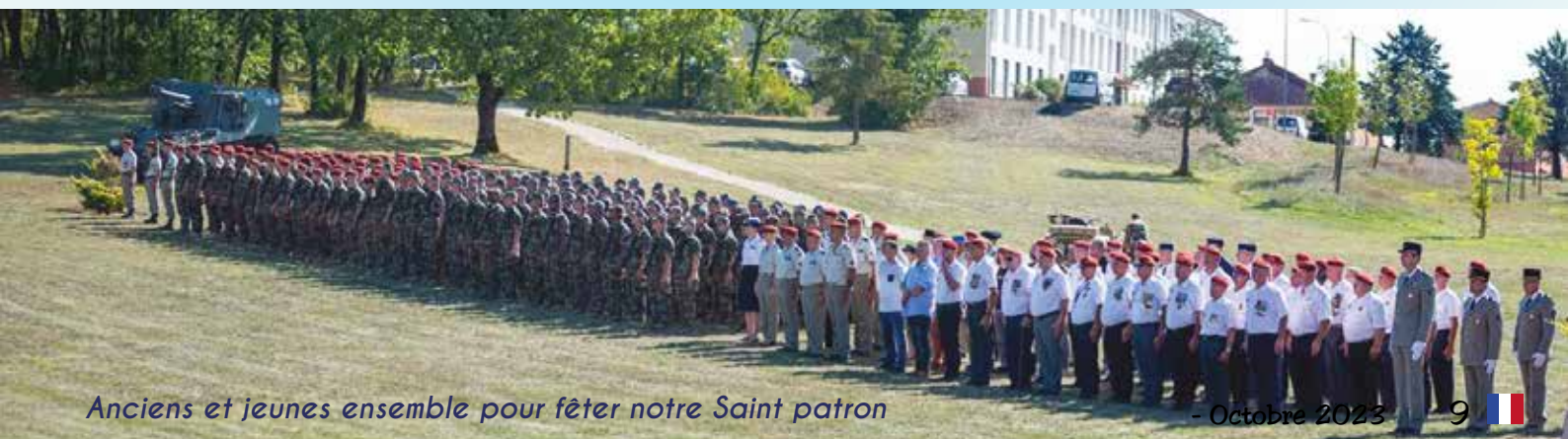
Anciens et jeunes ensemble pour fêter notre Saint patron