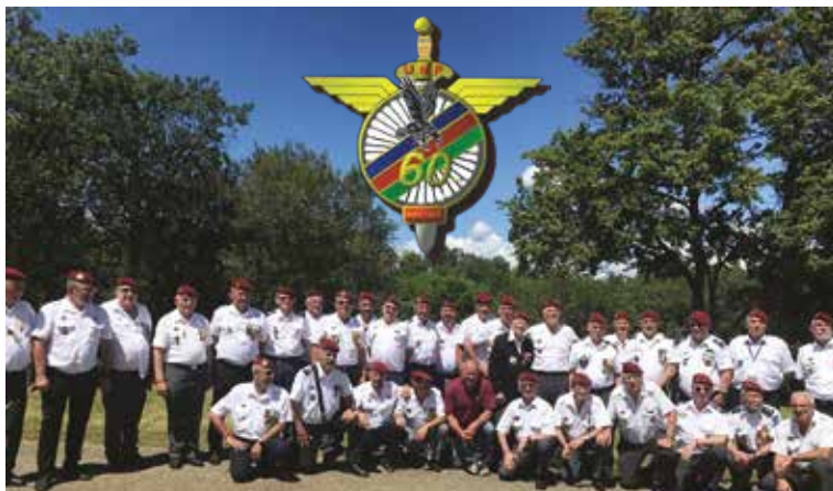
Les membres de notre amicale au congrès UNP

21 juillet 2023. Commémoration des combats de juillet 1944 dans le Vercors. Quelques un des membres de notre amicale étaient présents à la nécropole nationale de Vassieux-en-Vercors qui regroupe les tombes de 187 maquisards et civils morts pour la France lors des combats qui se déroulèrent sur le plateau du Vercors en juillet 1944.