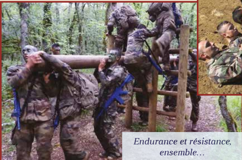
Endurance et résistance, ensemble...