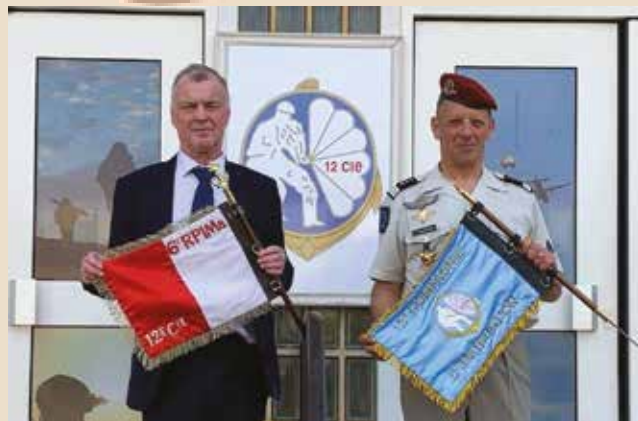
Deux capitaines de la 12. Un d'autrefois et celui d'aujourd'hui

La 12 du 6 : toujours debout ! Bien sûr, il y a beaucoup de différences entre celle autrefois et celle aujourd'hui. Autrefois : la formation initiale des appelés et la formation des caporaux et des sergents du régiment, un effectif beaucoup plus conséquent avec un encadrement exclusif 6 e RPIMA, le champ de tir de SPDM, le Frater et les Landes. Aujourd'hui : la formation initiale de tous les engagés volontaires des unités de la 11 e BP encadrés par des cadres détachés de ces unités, une commandement à faible effectif, un vaste et magnifique camp militaire où toutes les instructions terrain, tir et vie en campagne sont possibles. Mais l'objectif et l'esprit de la mission de la 12, autrefois comme aujourd'hui, sont toujours les mêmes : former nos jeunes paras dans l'endurance et la résistance physique et morale, dans leurs savoir-faire et leur savoir être. Et avec le sourire.