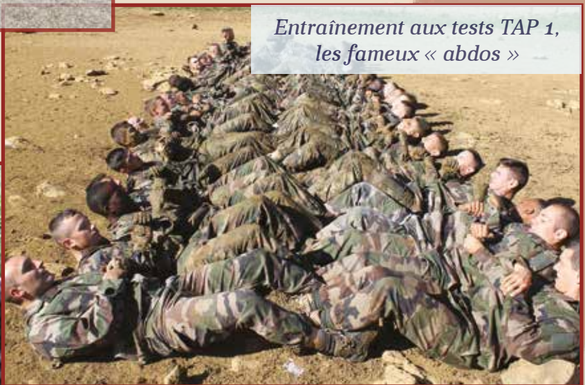
Entraînement aux tests TAP 1, les fameux « abdos »