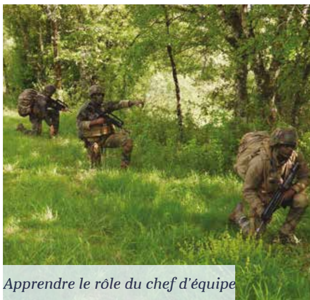
Apprendre le rôle du chef d'équipe

▲ Cérémonie de remise de l'Attestation de Fin de Formation Initiale Militaire aux jeunes EVI. « Vous êtes désormais des soldats de France. Le chemin continu, soyez fier de vous ! L'Archange Saint Michel veillera sur vous ! »