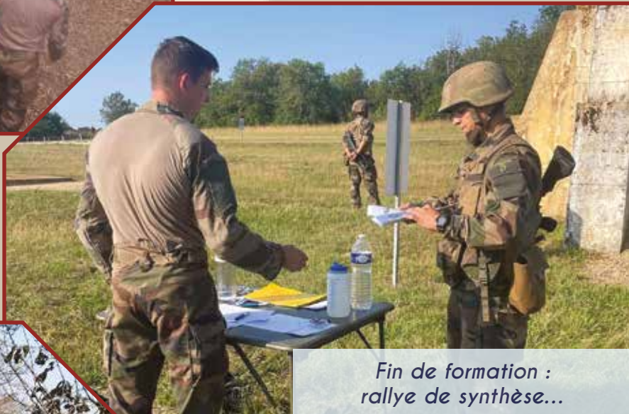
Fin de formation : rallye de synthèse...