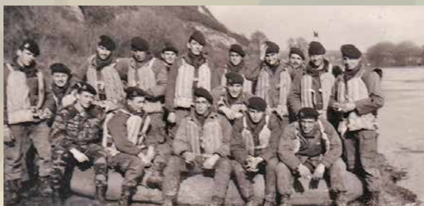
Août 1962 - La 2 e section de la 2 e compagnie du 6 e RPIMa au bord de la Meuse lors d'un stage commando au CEC de Givet (Ardennes).

Peut-être quelques-uns parmi nos amicalistes se reconnaîtront ou reconnaîtront quelqu'un.