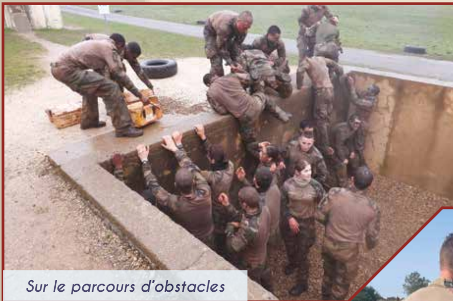
Sur le parcours d'obstacles