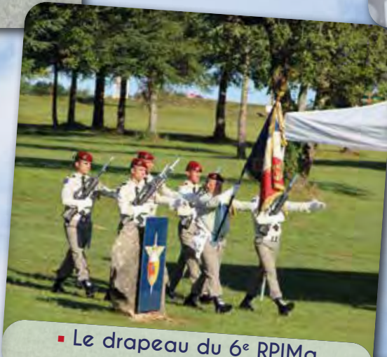
▪ Le drapeau du 6 e RPIMa et sa garde