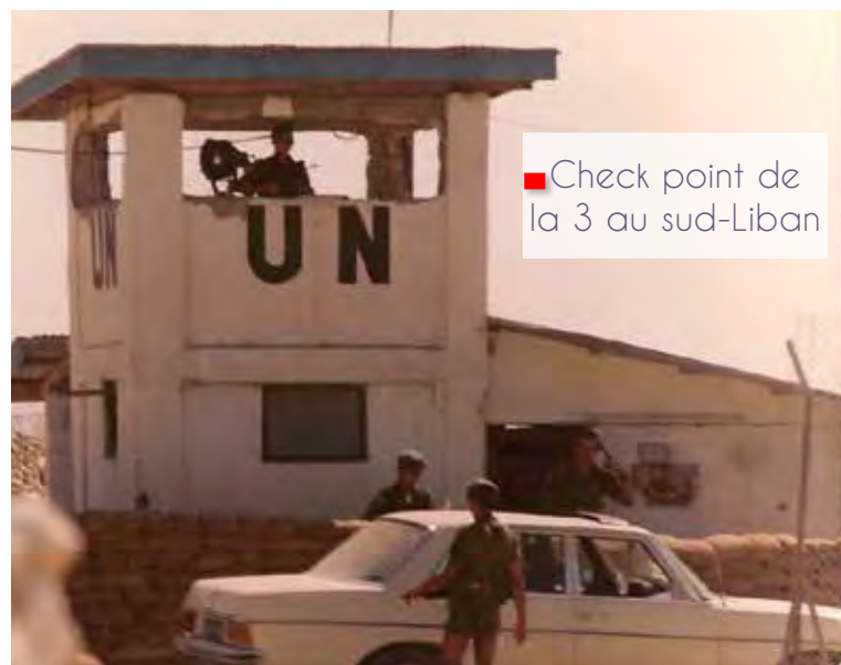
■ Check point de la 3 au sud-Liban

Le 7 décembre 1984, la troisième et dernière rotation du régiment se pose à Toulouse. Le 6 une fois de plus a cru et osé ... et a gagné !