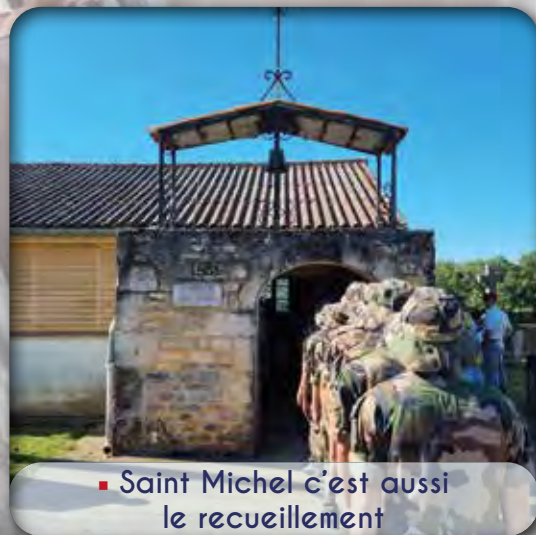
■ Saint Michel c'est aussi le recueillement