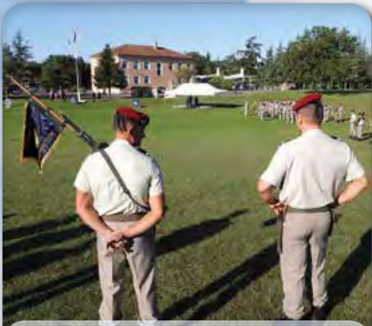
▪ Fanion en place