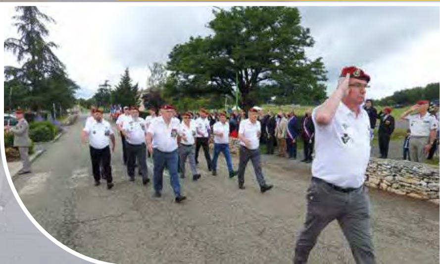
Ils défilent même lors de la prise d'armes derrière les troupes...