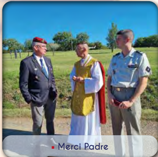
▪ Merci Padre