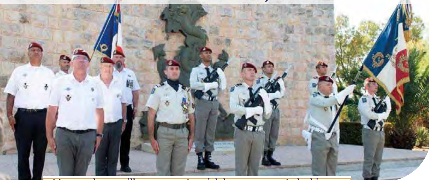
Moment de recueillement au mémorial des guerres en Indochine...