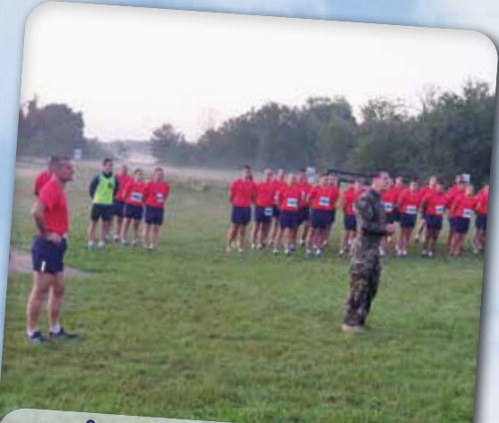
▪ Saint Michel au 6 e RPIMa c'est 6,6 km