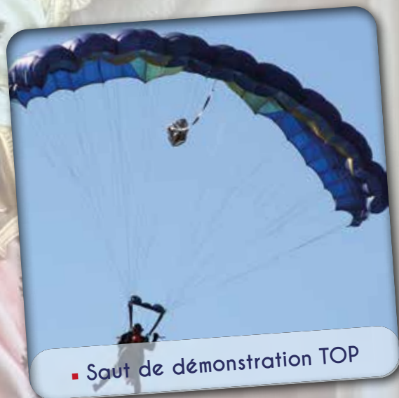
■ Saut de démonstration TOP