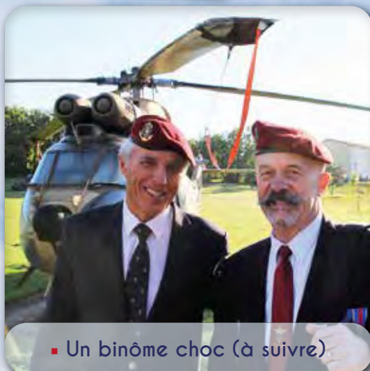
▪ Un binôme choc (à suivre)