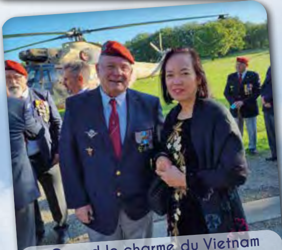
▪ Quand le charme du Vietnam rejoint la séduction du para