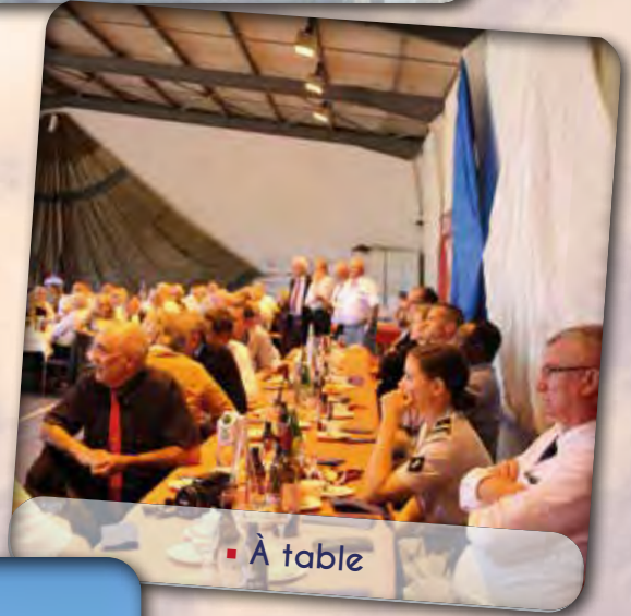
▪ À table