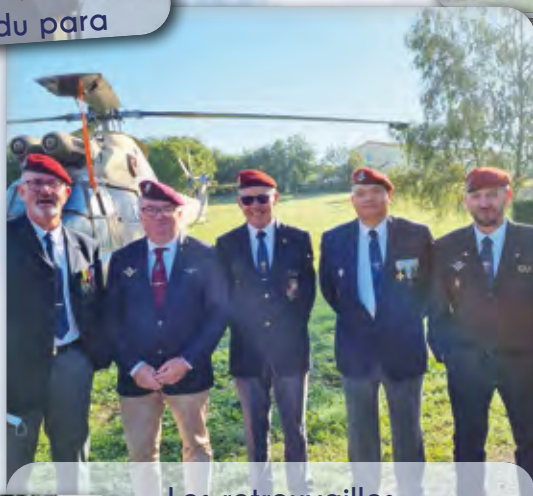
▪ Les retrouvailles