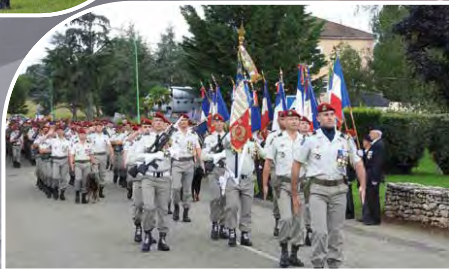
Un défilé devant les autorités civiles et militaires, les invités et les familles et amis clôture la passation de commandement, avec à sa tête le nouveau chef de corps.