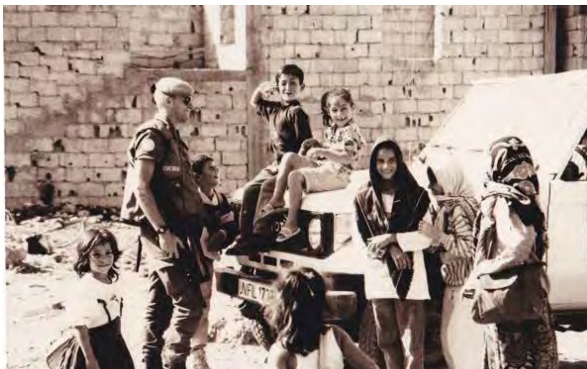
■ Les enfants du Liban