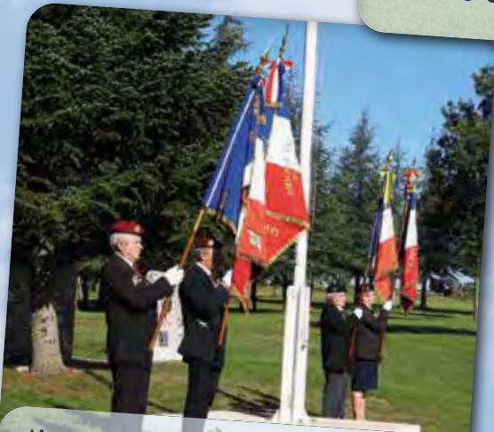
▪ L'amicale du 6 et invités en place