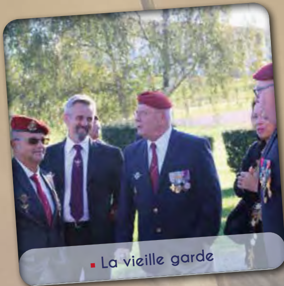
■ La vieille garde