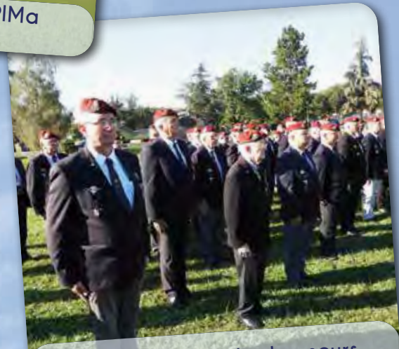
▪ L'Amicale pour les honneurs