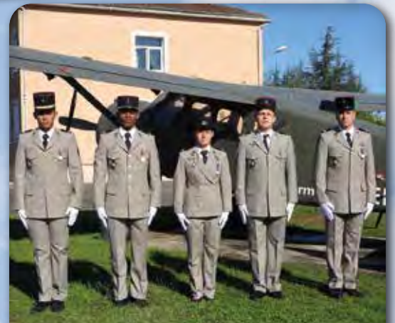
▪ Récipiendaires sortez des rangs