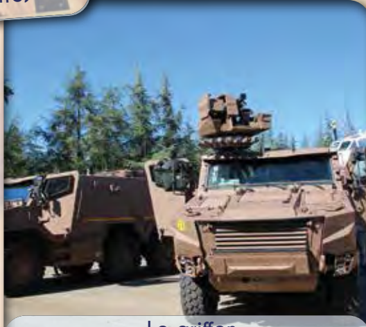
▪ Le griffon, un monstre de puissance