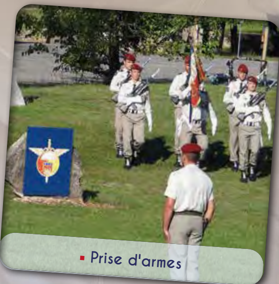
■ Prise d'armes