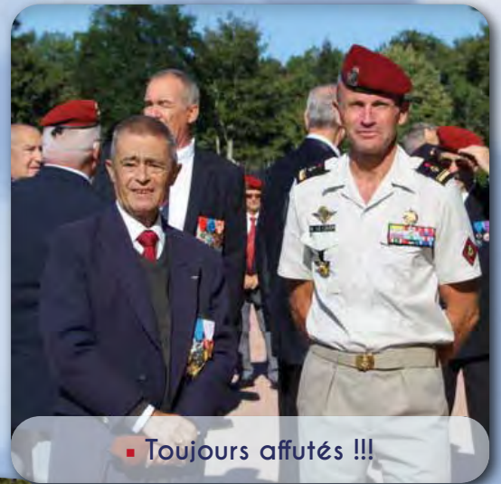
▪ Toujours affutés !!!