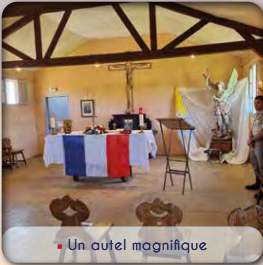
▪ Un autel magnifique