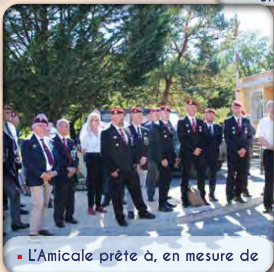
▪ L'Amicale prête à, en mesure de