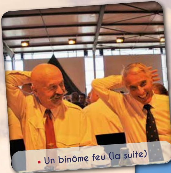
▪ Un binôme feu (la suite)